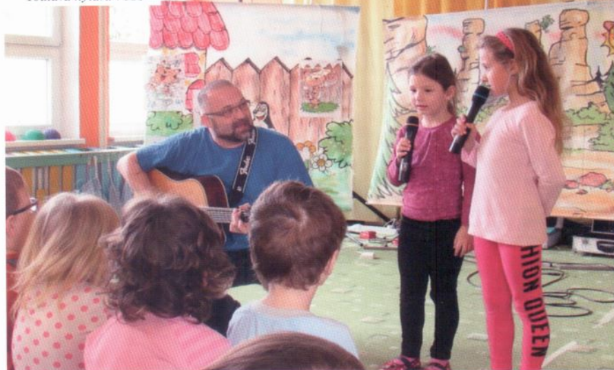
Toulavá kytara v MŠ

budeme chtít někdy zopakovat. Toulavá kytara je název dalšího hudebního pořadu. Už název mluví, oč jde. Melodie známých lidových písniček zněla celou mateřskou školkou. Děti si mohly vyzkoušet zpěv na mikrofon, a také si zatančily. Velkým překvapením byl velký bublifuk, který vyráběl sám bublinky. Kolektiv MŠ