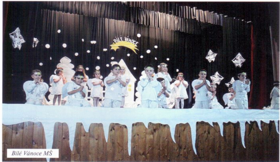
Bílé Vánoce MŠ

jedno oko suché. Podle ohlasů rodičů to byl skutečně nádherný podvečer, který jsme si všichni náramně užili. Kolektiv MŠ