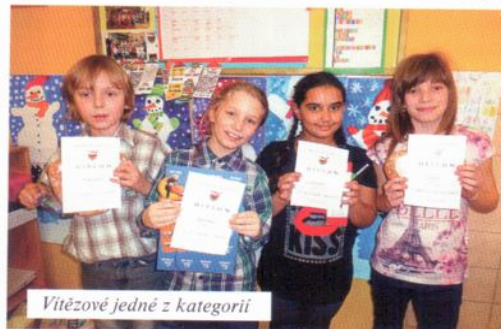
Vítězové jedné z kategorií