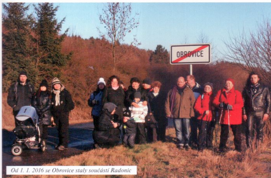
Od 1. 1. 2016 se Obrovice staly součástí Radonice

Zpravodaj Obecního úřadu Radonice ■ XIV. ročník, číslo 1 ■ (duben 2016)