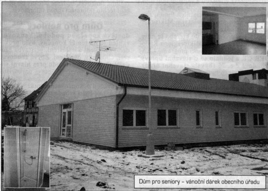
Dům pro seniory – vánoční dárek obecního úřadu

Zpravodaj Obecního úřadu Radonice ■ Ill. ročník, číslo 5 (17) ■ (prosinec 2005)