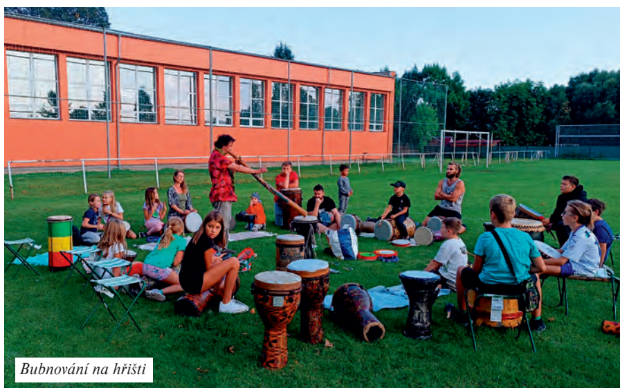
Bubnování na hřišti

Celkový počet uživatelů služby: 109 dětí a mladých dospělých Průměrný počet dětí na den: 16 dětí Kontaktů celkem: 2273 kontaktů Organizované vzdělávací a výchovné aktivity (besedy): 23 aktivit Mimořádné akce: 15 akcí