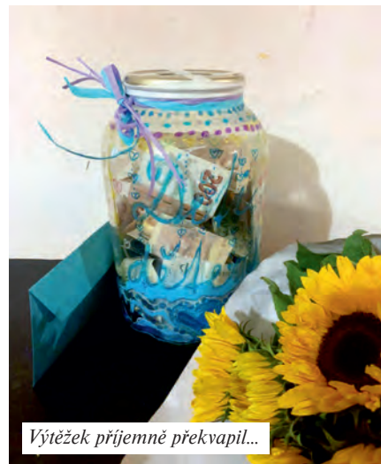
Výtěžek příjemně překvapil...