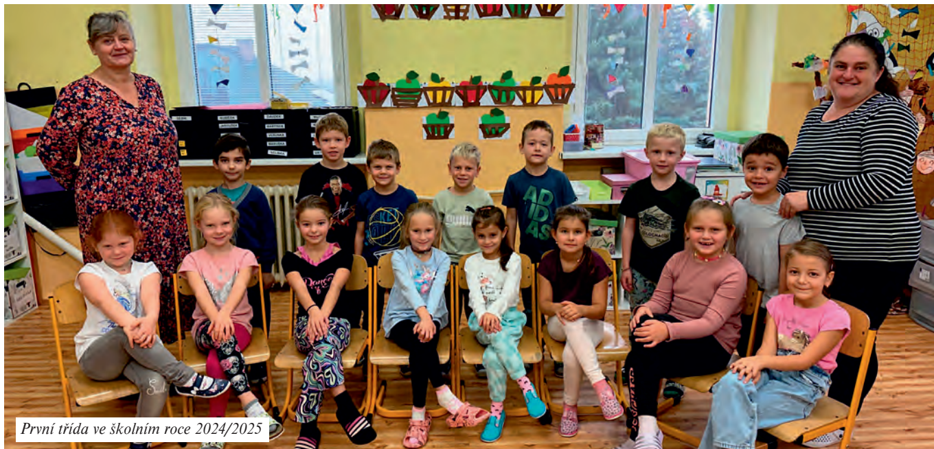
První třída ve školním roce 2024/2025

Zpravodaj Obecního úřadu Radonice ■ XXII. ročník, číslo 3 ■ (říjen 2024)