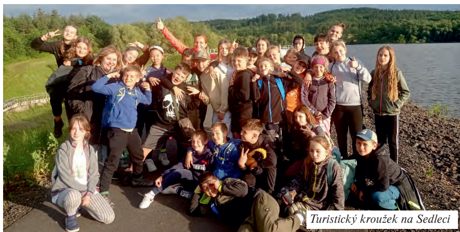
Turistický kroužek na Sedleci

v níž jsme si připomněli letošní turistické výlety. Večer jsme se vydali zpět pěšky, cesta nám utíkala i díky kartičkám s úkoly. Tančili jsme do příštího úkolu nebo předváděli různá zvířátka a u školy už děti čekalo závěrečné zhodnocení celého roku, každý turista si zasloužil medaili a sladkost. Báli jsme se počasí, ale nakonec vše krásně vyšlo a my už se můžeme těšit na výlety v novém školním roce. Romana Trnková