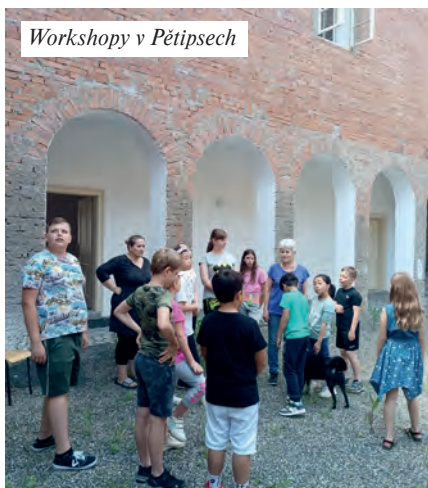
Workshopy v Pětipsech

V sobotu 8. června proběhl na zámku v Pětipsech první seminář. Děti z nízkoprahového zařízení pro děti a mládež NaNáměšti v Radonicích se zapojily do malířského workshopu. Prohlédly si zámek, učily se výtvarné techniky - kresba pastelem, portrét a monotyp. Výrobky si odvezly domů. Naučené techniky využijí v budoucnu, mohou tak třeba trávit volný čas. Pro většinu dětí to byla první zkušenost s účastí na workshopu.