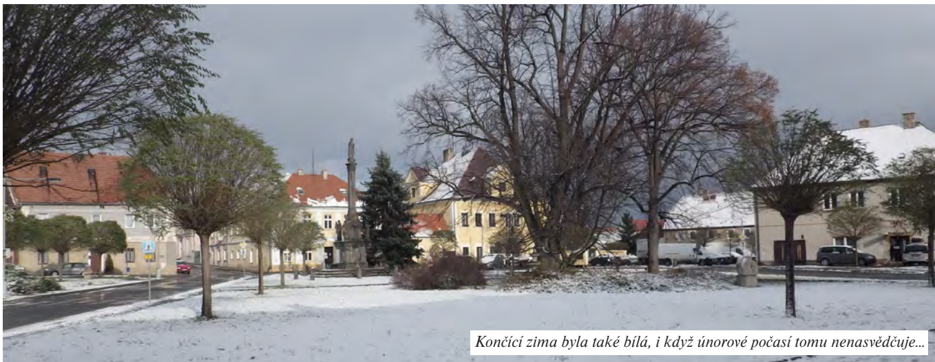
Končící zima byla také bílá, i když únorové počasí tomu nenasvědčuje...

Zpravodaj Obecního úřadu Radonice ■ XXII. ročník, číslo 1 ■ (únor 2024)