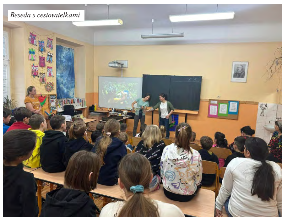
Beseda s cestovatelkami