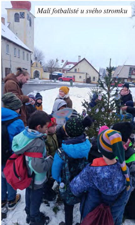
Malí fotbalisté u svého stromku