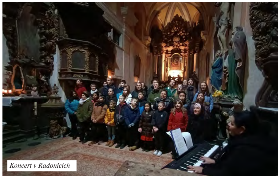
Koncert v Radonicích