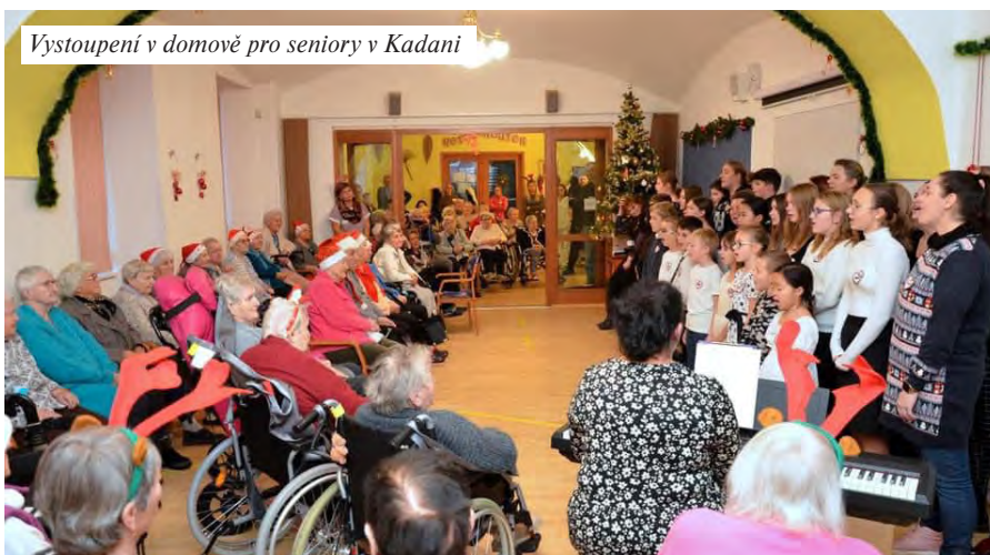
Vystoupení v domově pro seniory v Kadani