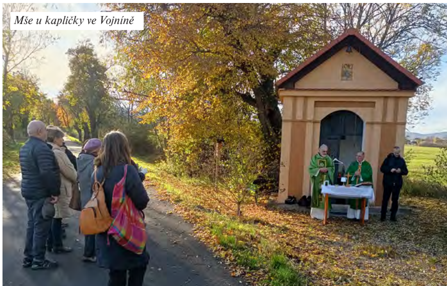
Mše u kapličky ve Vojníně