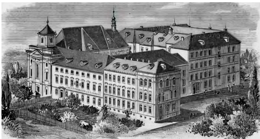
Stiftungs-Obergymnasium und Fürst-Erzbi Studentenkongvikl in Duppau