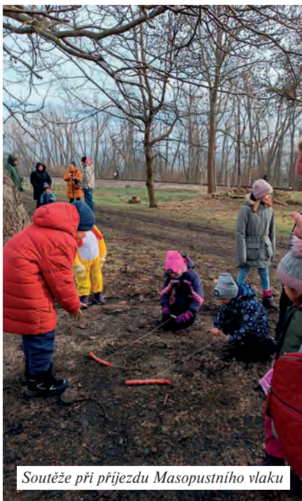
Soutěže při příjezdu Masopustního vlaku