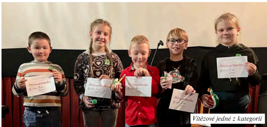
Vítězové jedné z kategorií

V pondělí 27. března se v kinosále obecního úřadu konal 18. ročník pěvecké soutěže Staň se naší SuperStar 2023. Odvahu vystoupit s mikrofonem v ruce mělo tentokrát více než dvacet dětí, které zpívaly v pěti kategoriích. Nejvíce bylo prvňáčků, pro které to byla první veřejná premiéra a zvládly to na jedničku. Všichni mladí zpěváci připravili pro diváky příjemné odpoledne plné písniček. Zazněly písně lidové, filmové, staré i současné, české i anglické. Jejich výkony hodnotila odborná porota a všichni byli odměněni. Zaslouží si to. Protože sólově vystoupit, to chce pořádný kus odvahy a kuráže a ta ani tentokrát nikomu z nich nechyběla. Děkujeme za krásné odpoledne! Ivana Hieková