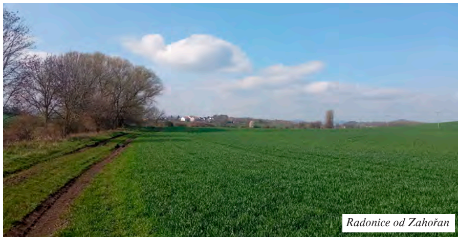
Radonice od Zahořan

Zpravodaj Obecního úřadu Radonice ■ XXI. ročník, číslo 1 ■ (duben 2023)