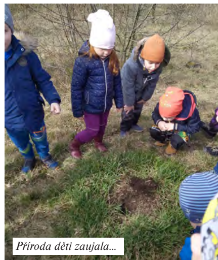
Příroda děti zaujala...