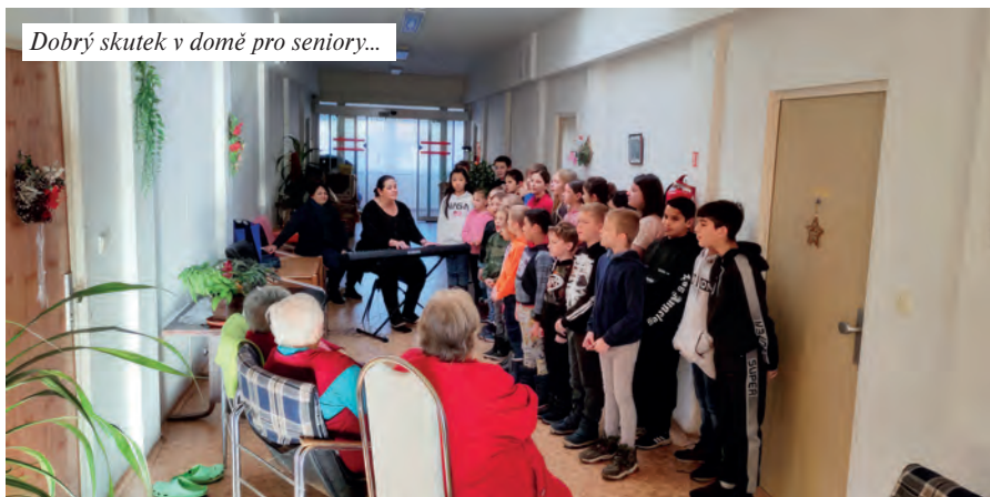
Dobrý skutek v domě pro seniory...

Naše škola se zapojila do krásného projektu, jehož cílem bylo udělat někomu radost. Žáci třetí třídy vyrobili přání PF a andělky, kteří mají obdarované po celý rok 2023 ochraňovat. Ještě se naučili básničku Vánoční přání a mohli vyrazit konat dobrý skutek. První cesta vedla do školní jídelny, kde jsme poděkovali našim kuchařkám za to, že nám moc dobře vaří. Poté jsme navštívili kamarády a paní učitelky v mateřské školce. Tam děti zavzpomínaly a pochlubily se, jak