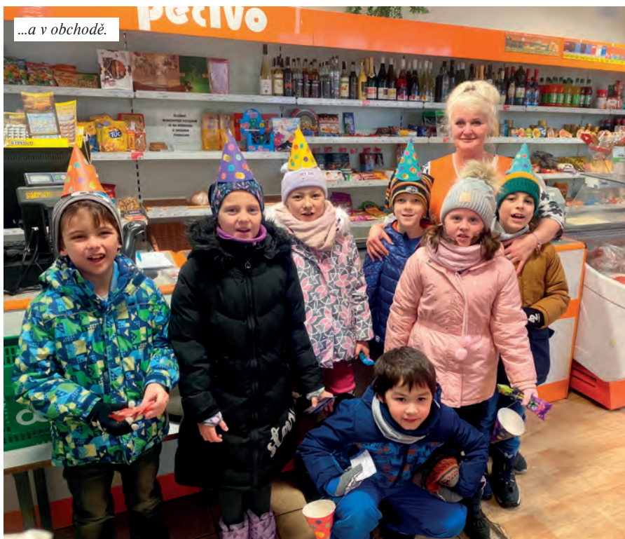
...a v obchodě.