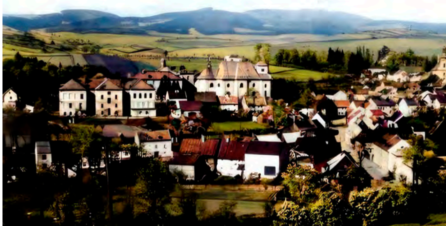
Doupov s klášterem a kostelem