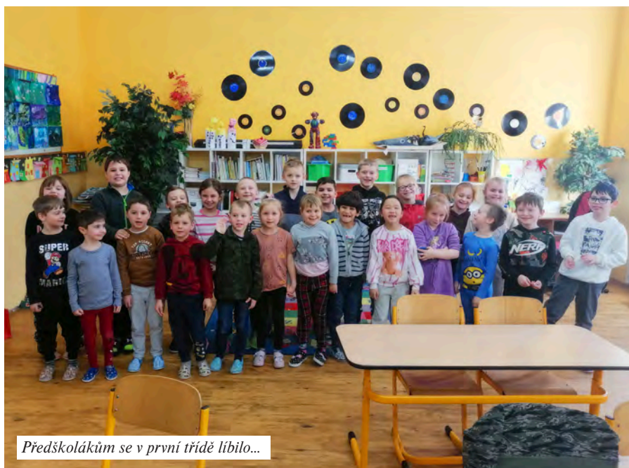
Předškolákům se v první třídě líbilo...

Už během září jsme si ve třídě dali svoji třídní výzvu – být během dopoledne bez mobilních telefonů. Samozřejmě jsme mohli ve škole mobily zakázat, ale my jsme to chtěli dokázat sami, bez zakazů. Jaká byla odměna? Když to vydržíme, budeme v prosinci nocovat ve škole. Dlouho jsme nemohli najít termín, který by nám vyhovoval. Nakonec se termín našel – čtvrtek 15. prosince! Sešli jsme se v 19 hodin a začali jsme vše připravovat. Slavnostní stoly, občerstvení, pítí, dárky pod ozdobený stromček, svíčky – prostě vše, co je třeba, aby mohl proběhnout Štědrý večer ve škole. My jsme si totiž nocování spojili s vánoční besídkou, a to bylo vůbec poprvé, kdy probíhala večer. Byla to úplně jiná atmosféra – ticho ve škole, venku tma, osvětlená okna i stromek, v celé škole jenom my. Co jsme dělali? Jedli jsme dobrotu, přijímali jsme a pronášeli slavnostními přípitky, rozdávali jsme si spousty dáreků, tančili jsme, hráli hry. Kolem půlnoci jsme si nachystali pelíšky a mohli jsme usnout sladkým spánkem. Ráno jsme posnídali čaj a donuty, dojížděli jsme i dobrotu z večera. Některým žákům se nechtělo vůbec vstávat, ale v půl osmé už se škola začala plnit žáky, kterým začínala výuka. My jsme si výuku užili, hodně jsme odpocívali po náročné noci. Bylo to moc pěkné, všichni jsme byli spokojeni. Vladimíra Veselá