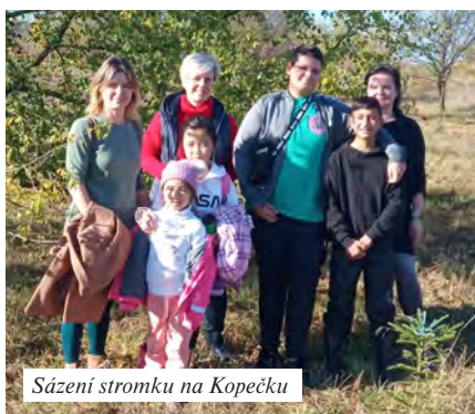
Sázení stromku na Kopečku

V období od září do listopadu tohoto roku se uskutečnilo 474 kontaktů pracovníků s klienty NZDM, 58 intervencí, 82 výkonů poradenství, 35 příprav do školy, 45 uzavřených individuálních plánů, 46 infoservisů. Petra Neubauerová