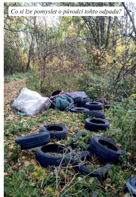
Co si lze pomyslet o původci tohoto odpadu?

Svoz a třídění komunálního odpadu je tématem pro většinu obcí a měst v naší republice, nejnak je tomu i u nás. Jsme malá obec, nemáme vlastní technické služby či dokonce skládku, tudíž jsme závislí na svozové společnosti, kterou je Skládky Vrbička (ve vlastnictví měst a obcí, tedy i Radonic). Ceny za svoz odpadu se odvíjí od zvyšujících se nákladů na pohonné hmoty, energie, mzdy aj., ale zvyšování je i způsobeno snahou omezit a téměř odstranit skládkování, jak to požaduje nový zákon o odpadech. Cílem této politiky je, aby občané v maximální míře třídili komunální odpad. Poplatky za uložení na skládku se budou každým rokem zvyšovat (z 500 Kč/t až na 1850 Kč/t) a v roce 2030 by mělo skládkování skončit úplně. Ponechme stranou, zda se podaří tohoto cíle dosáhnout, pro obec to znamená zvyšující platby za svoz odpadu a potažmo i pro občany. Pro letošní rok byl zvýšen poplatek za svoz komunálního odpadu o 50 Kč a nově byla schválena čtvrtá sazba za měsíční vývoz na popud některých obyvatel, kteří žijí sami. Naše obec šla i do řady projektů, které mají podíl směsného komunálního odpadu snížit – naši občané dostali nádoby na bioodpad, papír, plasty, měli možnost získat kompostéry, zřídili jsme vlastní kompostárnu, vloni byl otevřen sběrný dvůr, kde většinu odpadů vybíráme zdarma včetně pneumatik! Proto je s podivem, když otevřete popelnici na směsný odpad