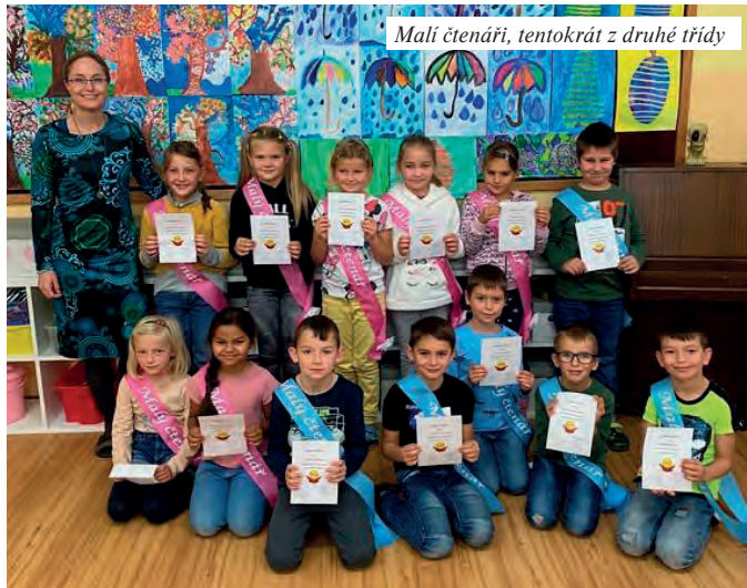
Malí čtenáři, tentokrát z druhé třídy