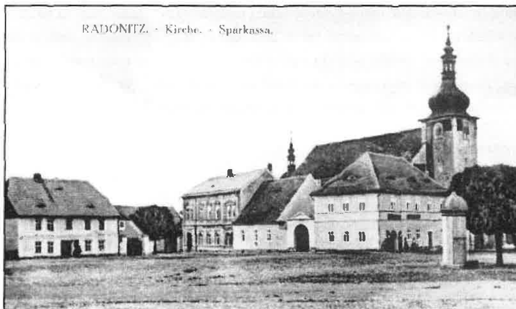
Náměstí v Radonicích, kostel Narození P. Marie, spořitelna (třetí dům zprava). Snímek kolem roku 1914.